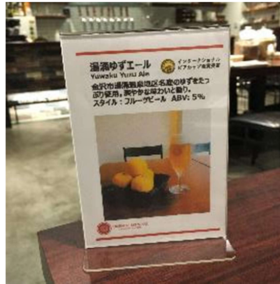
テーブルスタンド(A6) 14.8*10.5mm