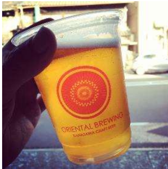
オリジナルカップ 400ml